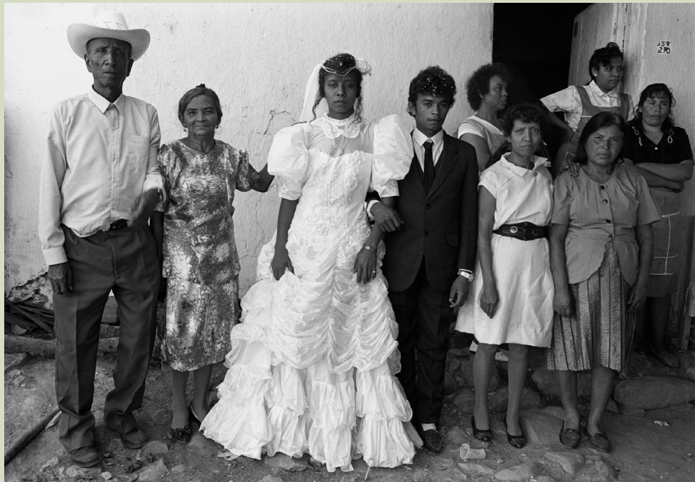
Boda Coyolillo Veracruz, 1994 (Manuel González de la Parra)

(blanca) la cual “etiquetó” a los africanos y sus descendientes como “negros”.