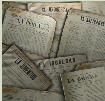
Figura 1: Periódicos afroporteños de las décadas de 1870-1880

comenzar a entrever el protagonismo de los afroporteños y de las afroporteñas en el entramado político-cultural de la época.